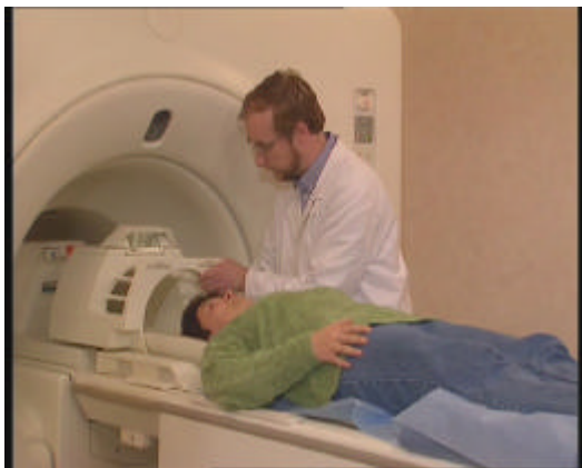
Résonance Magnétique Nucléaire (CEA) (12/1997) (9m30)