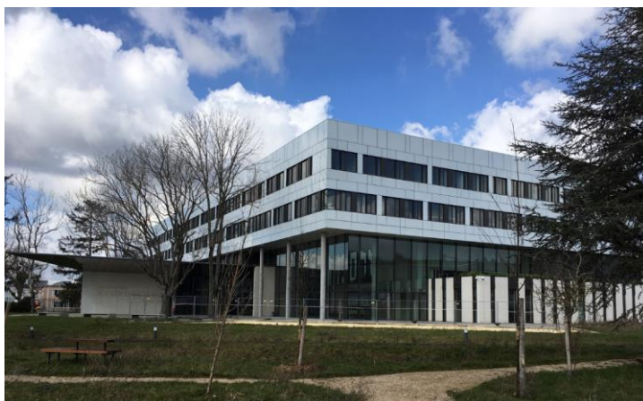
Fig. 4 : Le bâtiment Neurosciences