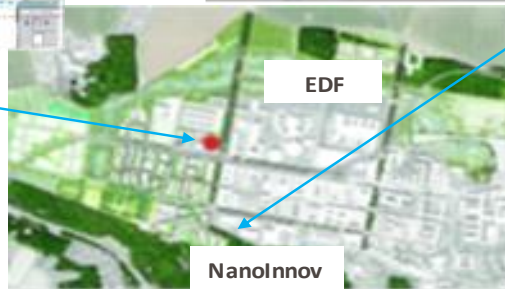
Fig. 5 : projet d'aménagement du plateau de Saclay