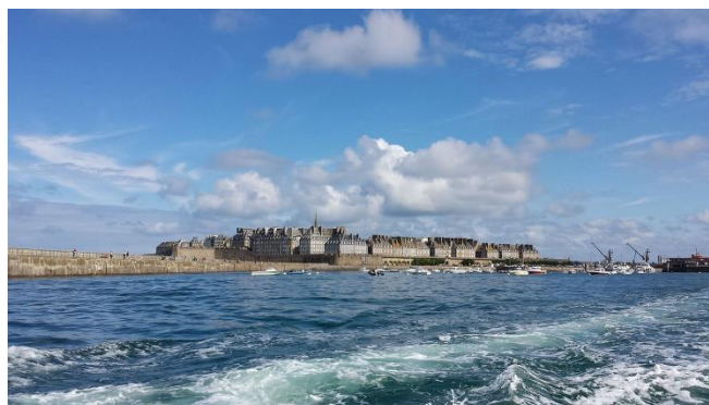
La ville de Saint Malo et ses remparts

Week-end de la Pentecôte (Voyage en car)