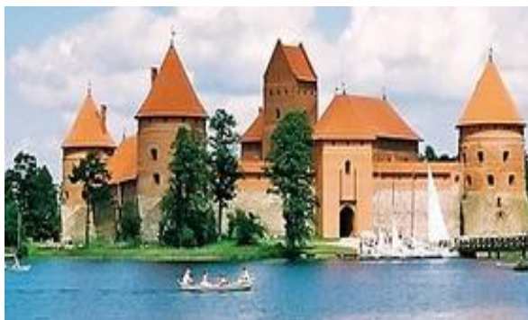
Vilnius, Trakāi, Kaunas, Klaipėda, Siaulai, Nida