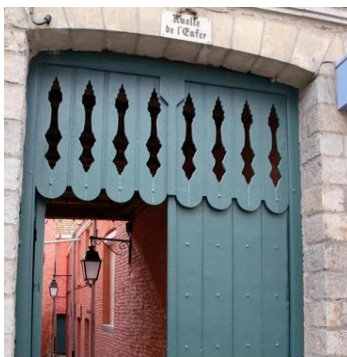
Rue de l'Enfer à Douai

St Quentin, ville Art Déco, le Cateau, Musée Matisse, Roubaix, Musées du Textile et de la Piscine, le Vieux Lille et son musée Comtesse, Douai et Arras.