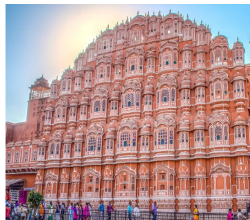
Jaipur « la Rose »