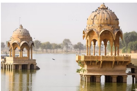
Udaipur, lac Pichola

Le 1 er novembre 1956, quand les anciens États princiers du Rajputana se sont fondus pour la création de l'Inde, le RAJASTHAN prend sa forme actuelle.