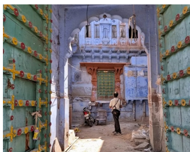
Jodhpur la Bleue

Le jaïnisme ou jinisme (du sanskrit : « vainqueur » et mata « doctrine ») est une religion qui aurait probablement commencé à apparaître vers le Xe ou IXe siècle av. J.-C. Le jaïnisme partage de nombreuses ressemblances plus ou moins évidentes avec l'hindouisme, le bouddhisme et le sikhisme.